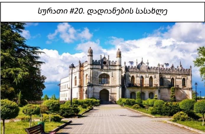
სურათი #20. დადიანების სასახლე