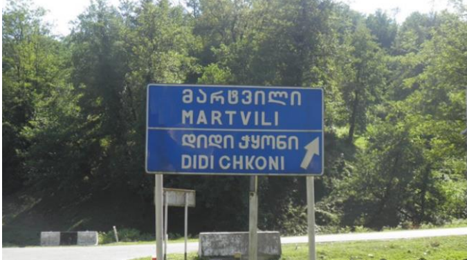
სურათი #14. ფირნიში

- ულამაზესი ადგილია! შესანიშნავი ბუნება, გიგანტური 17 კედლები, სიძველე - ყველგან სიძველე! - ამბობდნენ ბიჭები.