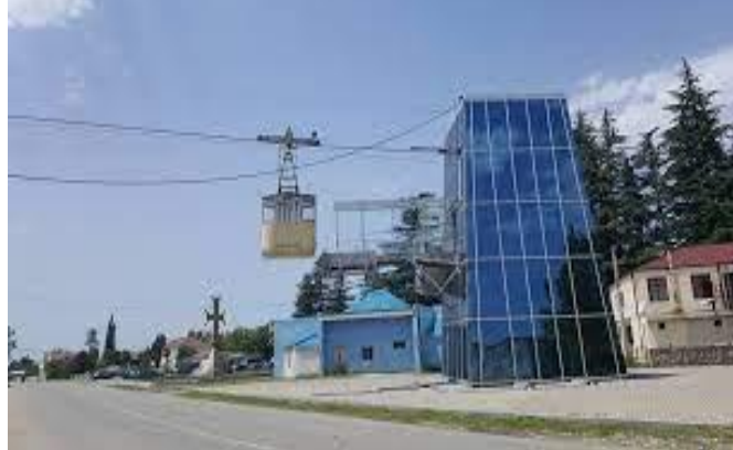
სურათი #19. მარტვილის საბაგირო გზა