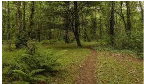
სურათი #7. კოლხური ტყე