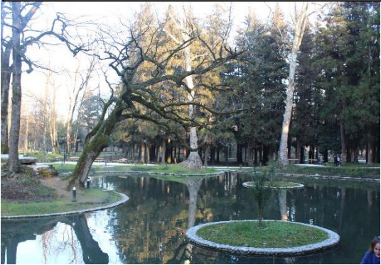
სურათი #21. ზუგდიდის ბოტანიკური ბაღი

- რა სილამაზეა! რამხელა კაშხალია! - აღტაცებულები არიან ბიჭები.