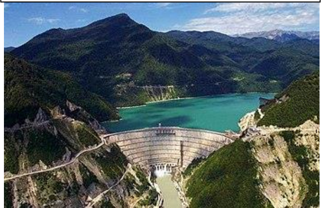
სურათი #1. ენგურის კაშხალი და წყალსაცავი