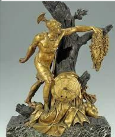
სურათი #3. იასონი იპარაცს ოქროს საწმისს

არგონავტებმა შეძლეს გაქცევა. მათ მრავალი წელი იცურეს საბერძნეთამდე და გამარჯვებულები დაბრუნდნენ სამშობლოში, თან ჩაიტანეს ოქროს საწმისი.