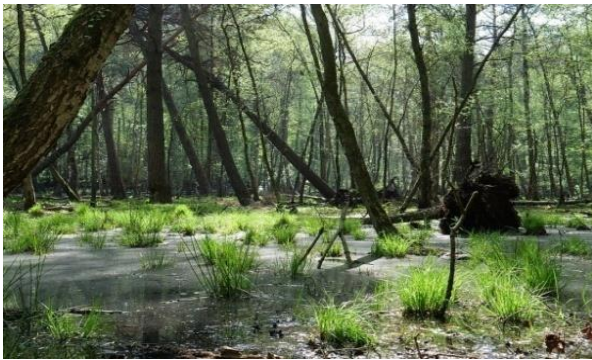
სურათი #6. კოლხეთის ჭაობი