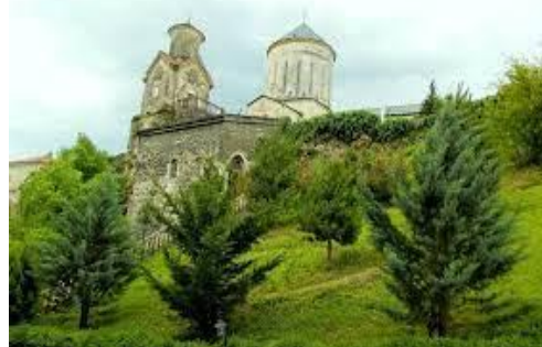
სურათი #18. ჭყონდიდი

მუხისაგან. ადრე ამ მთაზე ბევრი „ჭყონის“ (მუხის) ხე იზრდებოდა. ამიტომაც დაერქვა ამ ადგილს „ჭყონდიდი“.