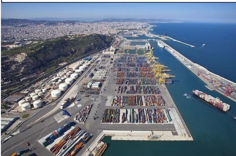
სურათი #10. ფოთის პორტი და ნავმისადგომი

მანქანებს, კომპიუტერებს, ტელეფონებს. აქედან გააქვთ უცხოეთში ქართული პროდუქტები: ღვინოები, სასმელი წყლები, ოქრო და მარგანეცი. ტვირთების რაოდენობა ყოველ წელს იზრდება. მათ ამწეებით უზიდებიან. ფოთის პორტში ოცზე მეტი საპორტო ამწე მუშაობს - უყვებოდა ბიჭებს ლალი.