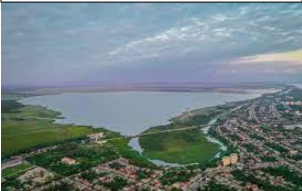
სურათი #5. პალიასტომის ტბა

- აი, პალიასტომის ტბა! - ამბობს ლია დეიდაძე, - პალიასტომის ტბა კოლხეთის ეროვნული პარკის ტერიტორიაზეა; პარკში არის უძველესი პერიოდის, უნიკალური 9 ცხოველები და მცენარეებიც. მათ დაცვაზე პარკის თანამშრომლები ზრუნავენ. კოლხეთის