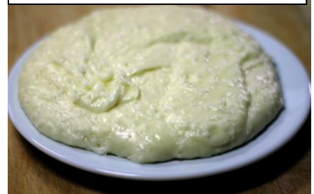
სურათი #15. ელარჯი

დეიღამ თავის მშობლებს სტუმრები გააცნო, ხელ-პირი უცებ დაიბანეს და ეზოში გაშლილ სუფრას მიუსხდნენ.